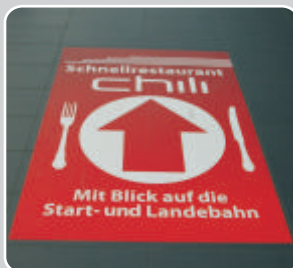
1,2 x 1,8m