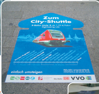
1,2 x 1,8m