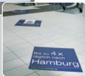
1,0 x 1,0m

Fußbodenaufkleber in allen Formen und Größen mit speziellem Anti-Rutsch-Laminat. Als Werbefolien, Wegleitsystem oder auch für Treppenstufen geeignet und zugelassen.