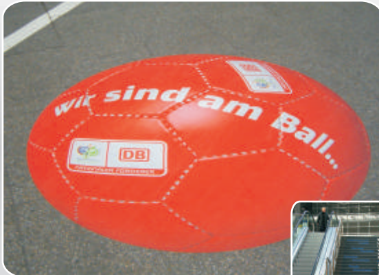
1,5 x 1,5m